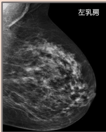
通常マンモグラフィ