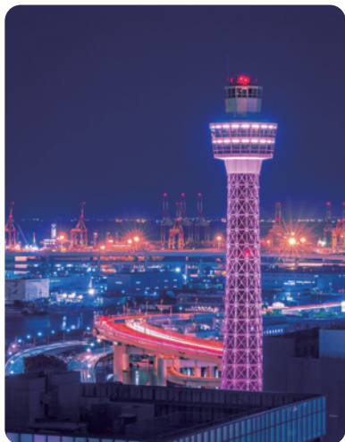
フォトコンテスト 最優秀作品